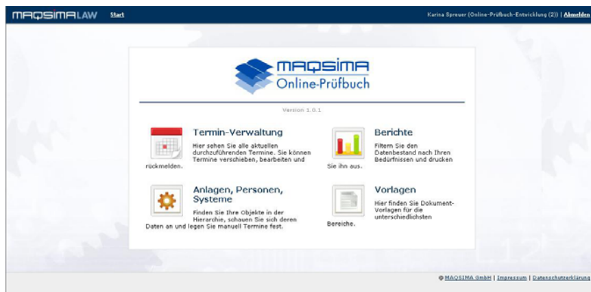
Abbildung: Startmaske Online-Prüfbuch

Das zweite neue Produkt im Geschäftsfeld „Responsibility Management“ ist ebenfalls im Herbst letzten Jahres online gegangen. Das neue Online-Prüfbuch der MAQSIMA GmbH hilft Betreibern technischer Anlagen bei der Erfüllung ihrer gesetzlichen Prüfpflichten. Auf Knopfdruck kann der Anlagenverantwortliche erkennen, welche Prüfpflichten für seine individuellen Anlagen nach dem heutigen Stand der Technik und der aktuellen Gesetzeslage gelten. Das Online-Prüfbuch ermittelt selbständig die jeweiligen Prüftermine und informiert den Betreiber der Anlage vor jeder Prüfung per E-Mail. Das Ergebnis der Prüfung wird direkt an der jeweiligen Anlage im Online-Prüfbuch hinterlegt und kann zu jeder Zeit und von jedem Ort aus per Internet abgerufen werden. Damit trägt das MAQSIMA Online-Prüfbuch entscheidend zur Sicherheit und Rechtskonformität des Unternehmens bei.